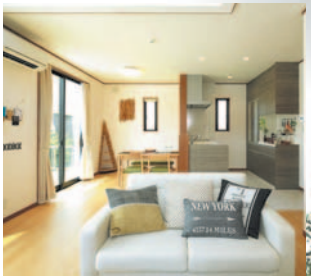
シンプルで暮らしやすい間取り