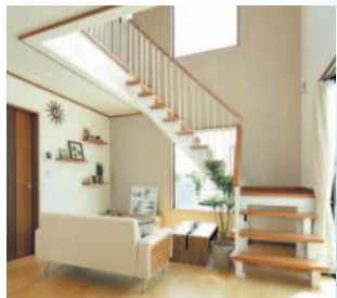
開放的な吹き抜けの階段

スタッフは常駐しておりませんので、見学をご希望なされる際は、お手数ですがWEBサイトもしくはお電話にてご予約をお願いいたします。